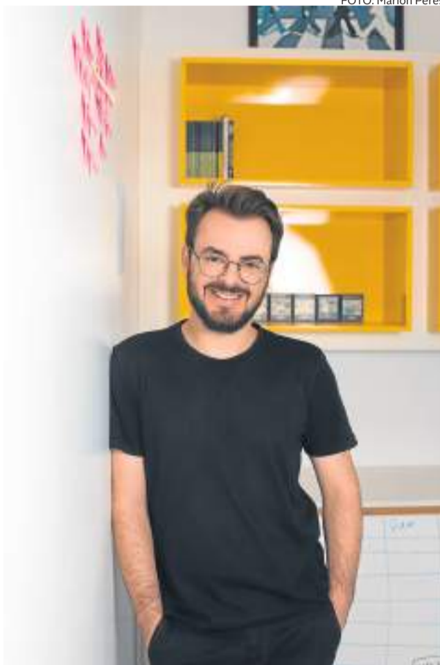
Artigo escrito pelo especialista em Marketing Político e Comunicação Eleitoral, Aléferson de Menez

Quem está dentro da bolha se recusa a entender outras realidades, outros discursos, outros fatores que são de fato relevantes. Em Farroupilha não é diferente. Existem duas bolhas claras. Existe uma ilusão, que se repete