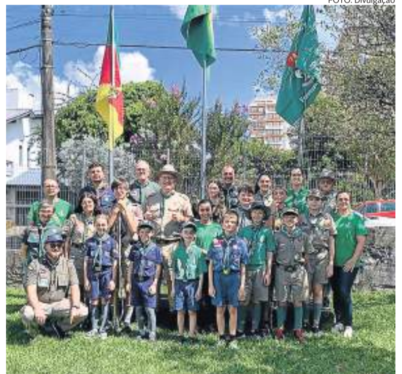
Grupo Guaracy 78 sempre atuante na cidade