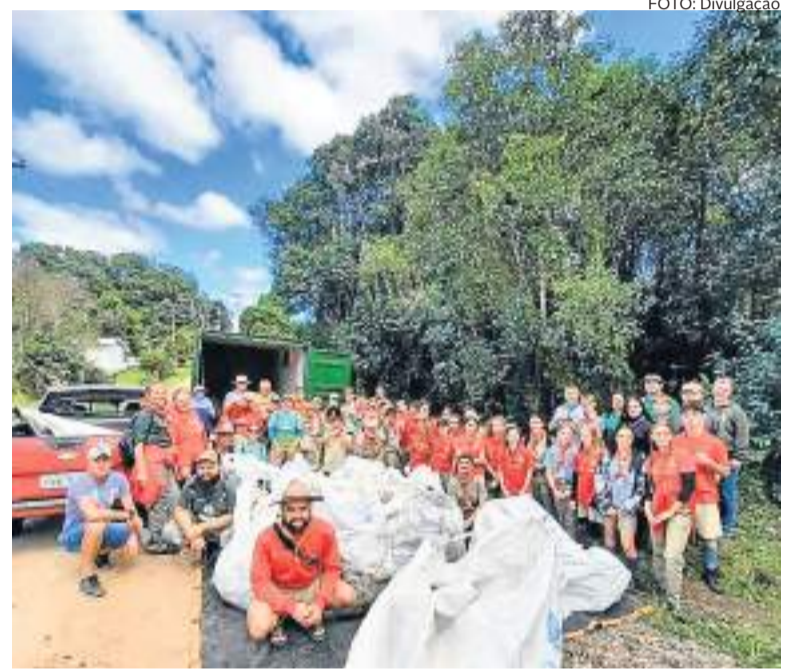
Grupo Escoteiro Salto Ventoso em ação na limpeza da Barragem da Julieta