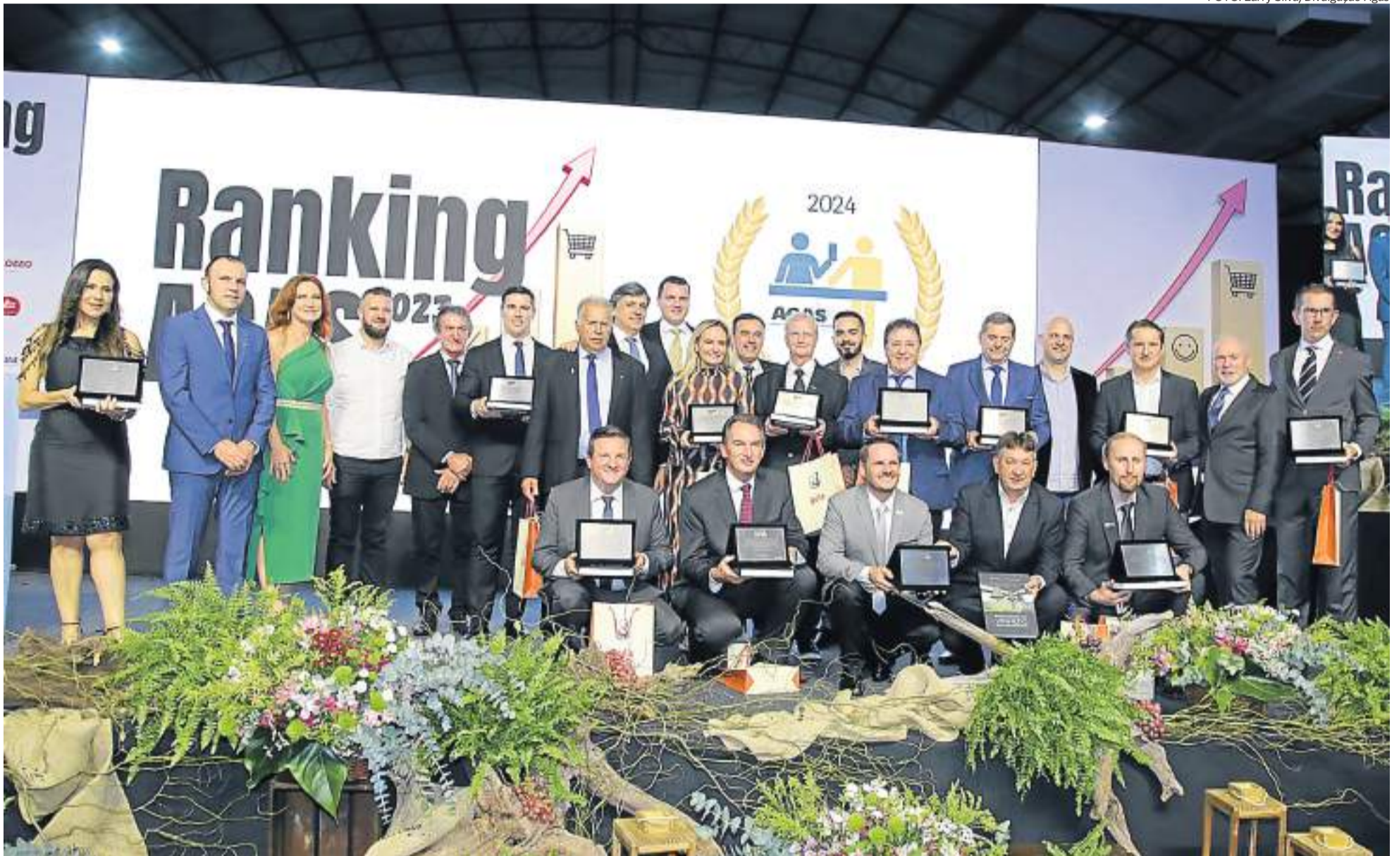
Pela primeira vez na Serra Gaúcha, entrega do Ranking Agas 2023 contemplou empresários e organizações comerciais do setor de supermercados, além de personalidades e entidades gaúchas, em festa realizada na noite de segunda, 8 de abril, em Bento Gonçalves

Silvestre Santos silvestre@ofarroupilha.com.br