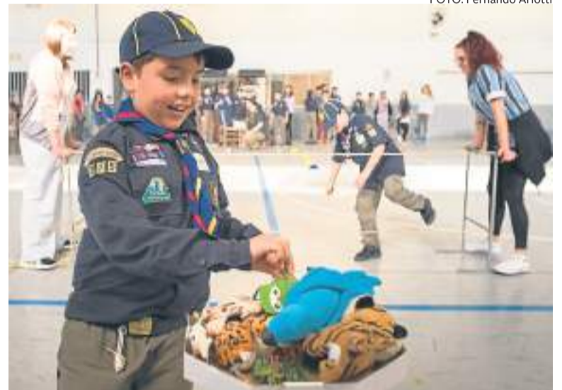
Grupo Rouxinol da Serra em ação na comunidade no Dia do Meio Ambiente em 2023