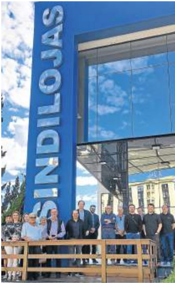
Empresários e dirigentes empresariais de Farroupilha se reuniram na sede do Sindilojas para viajarem à capital e participarem da reunião-almoço da Fecomércio