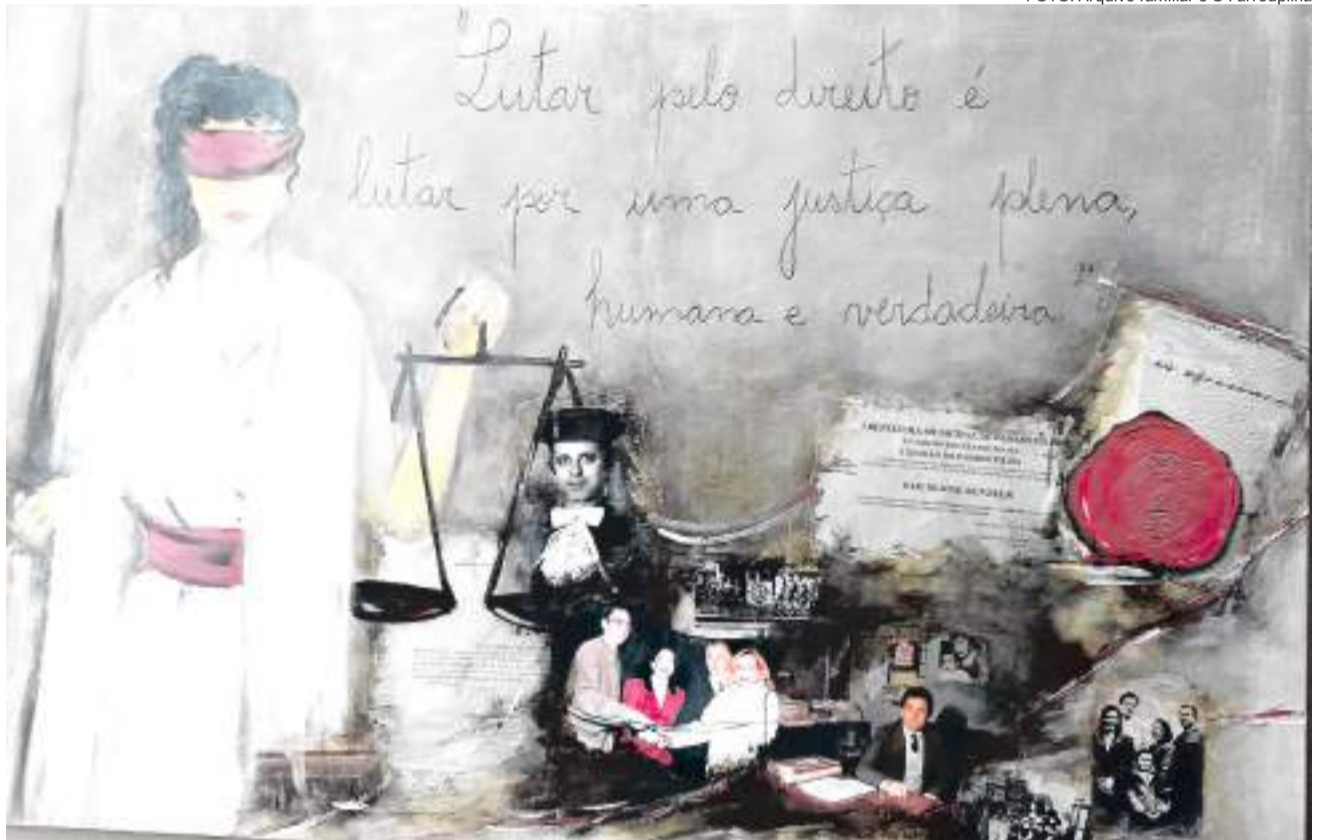
Na obra da esposa, um pouco da trajetória percorrida