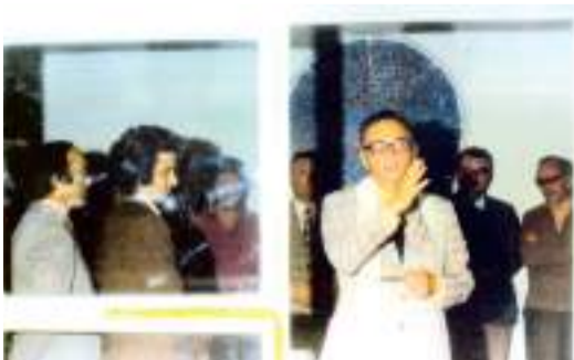
Inauguração do primeiro endereço, em 1975