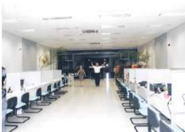
Sede própria, a realização de um sonho