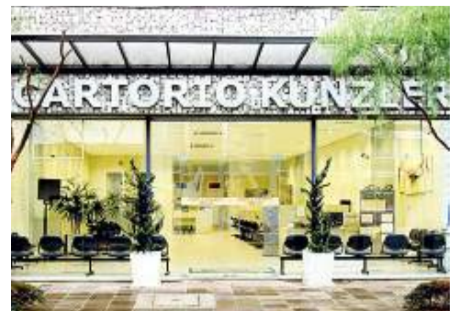
Atual endereço, na Pena de Moraes, 661